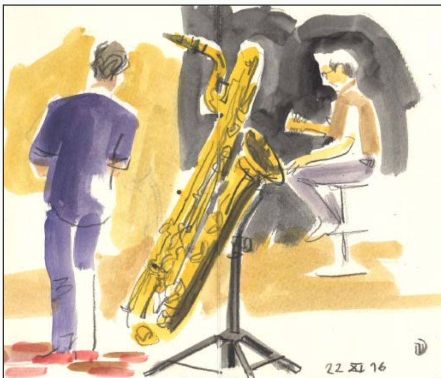
illustration : © Vincent Desplanches